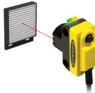
간단한 푸시버튼 티칭